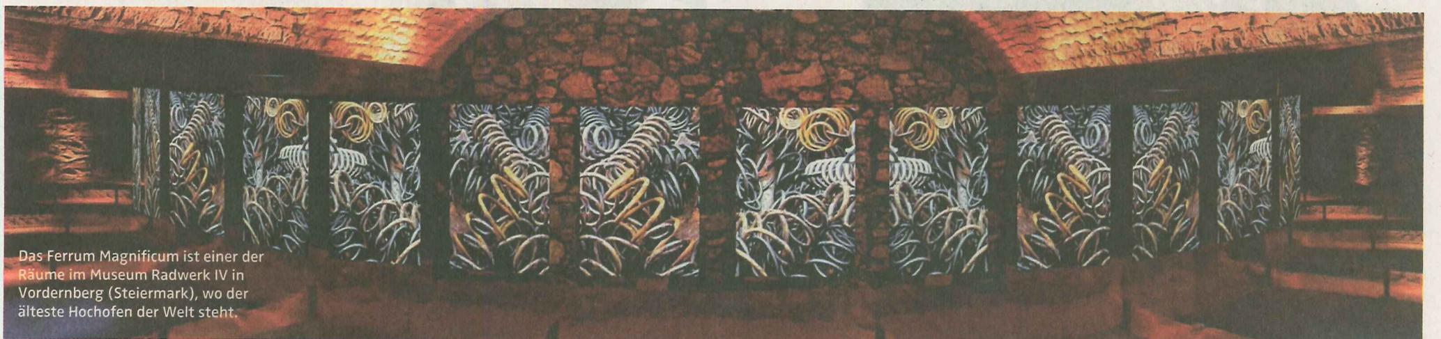
Das Ferrum Magnificum ist einer der Räume im Museum Radwerk IV in Vordernberg (Steiermark), wo der älteste Hochofen der Welt steht.